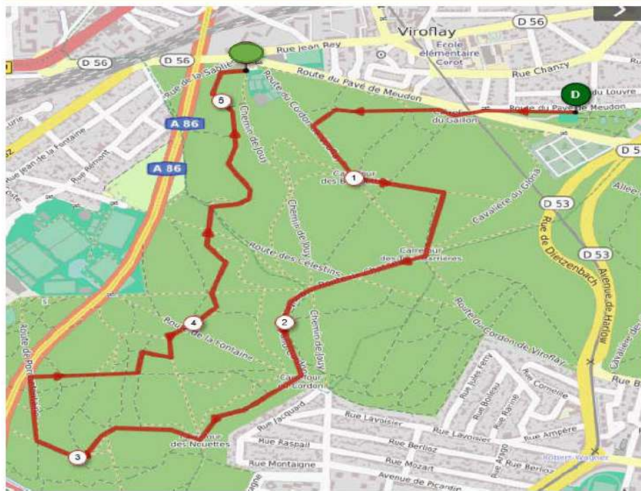
Tracé du Départ + Boucle 1 : 5200 m

Course 5 (cross long 11200 m) à 10h40 : Départ + Boucle 1 + Boucle 2 + Final